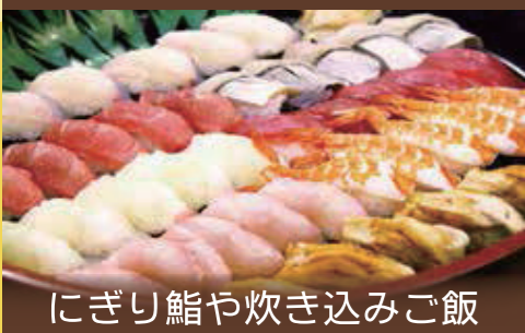
にぎり鮓や炊き込みご飯