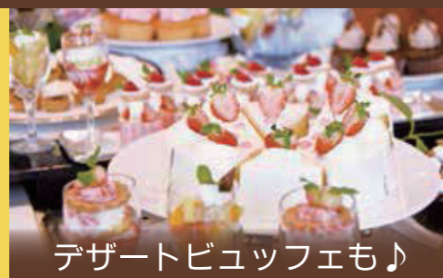
デザートビュッフェも♪