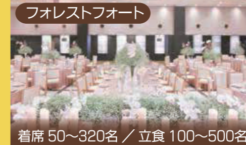
フォレストフォート